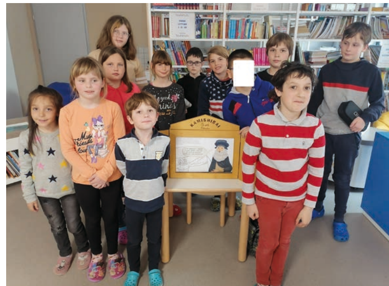
I giovani lettori con il kamishibai

Uno scienziato, inventore e artista italiano, vissuto tra il 1452 e il 1519.