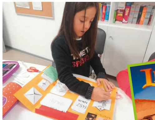
Gli alunni realizzano il lapbook

La Scuola elementare "Pier Paolo Vergerio il Vecchio" ha sede nel centro storico di Capodistria, più precisamente nel Collegio dei Nobili , importante edificio cittadino che da sempre offre i suoi spazi all'istruzione e all'educazione; la scuola inoltre dispone di una sede dislocata per le classi dalla I alla V in Piazzale Vergerio , nonché delle sedi periferiche di Semedella, Bertocchi e Crevatini . A scuola si impara e si espande il proprio sapere , la scuola è tanto più bella e preziosa quando permette di vivere esperienze e offrire occasioni che arricchiscono il bagaglio personale degli alunni, quei momenti in cui i