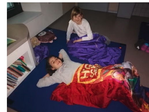
Al risveglio in biblioteca!

Leonardo ideò numerose invenzioni , alcune di esse, come la macchina volante, furono veri e propri prototipi .